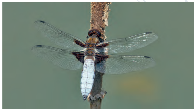
Libellule déprimée

L'étang abrite oiseaux, reptiles, amphibiens, libellules et plantes aquatiques diverses. Les panneaux didactiques présentent quelques-unes des espèces à observer. Un beau chêne bicentenaire est aussi présent sur le site.